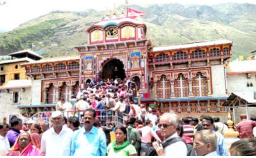
बद्रीनाथ मंदिर आणि परीसर

निसर्ग बघण्याची इच्छा झालीच पाहिजे. तेथे जाणे सहज आहे असे वाटते पण तिथला प्रवास फार खडतर आहे. हे तिथे गेल्यावरच कळू शकते. हे मंदिर १३ व्या शतकात बांधले गेले आहे. १३ किमी व्यास असलेले हे मंदिर उत्तराखंडातील चमेलीपासून ३१३३ मीटर उंचीवर आहे. भारतातील चार मुख्य धामांपैकी (जगन्नाथपुरी, द्वारका, बद्रीनाथ, रामेश्वर) बद्रीनाथ एक धाम आहे. अलखनंदा नदीच्या तीरावर नैना पर्वत व तप्तकुंडाजवळ आहे. ह्या कुंडात गरम पाण्याचे झरे आहेत. ह्यात स्नान करूनच भाविक बद्रीनाथच्या दर्शनाला जातात.