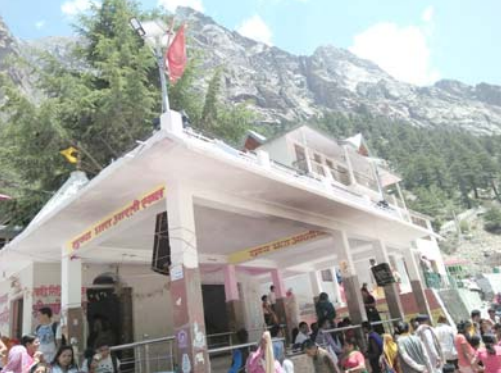
गंगोत्री मंदिर आणि परीसर

दुसऱ्या दिवशी दि. १ जून सकाळी ५.३० वाजता लवकर उठून गंगोत्रीकडे रवाना झालो. प्रवास खडतरच. वाटेत मध्येच गरम पाण्याच्या कुंडात स्नान करून दुपारी २.०० वाजता गंगोत्रीमातेचे दर्शन घेऊन परत मणेरला मुक्कामाला आलो. काय आहे ह्या गंगोत्री स्थानाचे महत्त्व ते बघू. चारधामातील हे दुसरे महत्त्वाचे स्थान. गंगोत्री ते गौरीमुख आणि तपोवनला जाण्याची सुरुवात होते. तेथूनच गंगेचा उगम होतो. हे मंदिर हिमालय पर्वत रांगेत साधारण ३१०० मीटर उंचीवर उत्तरांचल ह्या उत्तराखंडावर स्थित आहे. हिवाळ्यात हिमवर्षाव होत असल्याकारणाने हे मंदिर बंद असते. उन्हाळ्याच्या सुरुवातीला ते उघडते. २५० वर्षापूर्वी अमरसिंग थापा ह्याने हे मंदिर बांधले. सन १९०० मध्ये जयपूरच्या राजघराण्याने ह्या मंदिराचा जिर्णोद्धार केला. गंगोत्री मंदिर भगीरथी नदीच्या तीरावर असून गंगामातेचे हे पवित्र स्थान आहे. भगीरथाने अपार तप करून आपल्या पूर्वजांचा उद्धार करण्याकरिता गंगामातेला पृथ्वीवर आणण्याचा निश्चय केला. त्याचे तप बघून गंगामाता पृथ्वीवर अवतरण्यास तयार झाली. पण गंगामातेच्या अतिभव्य प्रवाहाच्या वेगाने पृथ्वीचा नाश होऊ नये यासाठी भगवान श्री शंकरानी तिला आपल्या जटेट धारण करण्याची तयारी दाखविली. श्री शंकराच्या जटांतून