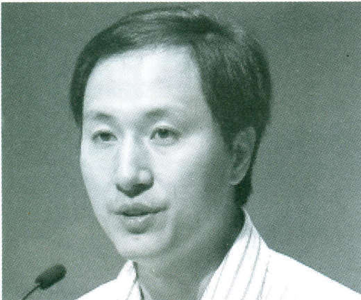
He Jiankui, जनुकांच्या शृंखलेमध्ये हस्तक्षेप करून पहिल्या Designer Baby चा निर्माता शास्त्रज्ञ (नोव्हेंबर २०१८).

सध्या विज्ञानानी अशीच एक कवी-कल्पना वास्तवात उतरवली आहे.